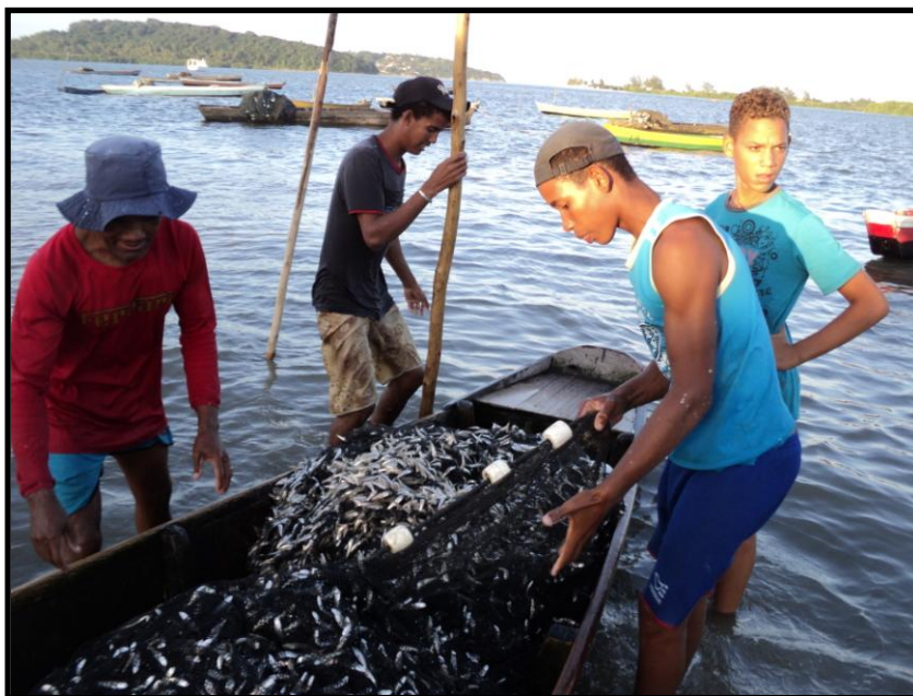
Figura 5: Pescadores chegando da pescaria com baiteira sem motor carregado de manjubinha.

Como fruto de nossa legislação foi possível saber que este sistema de pescaria visa a captura de várias espécies. As pescarias são realizadas por pescadores que não utilizam embarcações (que têm acesso aos pesqueiros sem nenhum transporte ou utilizando meios simples como bicicletas e carroças) ou que utilizam aquelas movidas à remo e/ou vela (Figura 5) que transportam até sete pescadores. Essas embarcações não têm convés ou podem tê-lo de forma semifechada; com ou sem casaria, com quilha. São também vulgarmente conhecidas como baiteiras. Fazem viagens de aproximadamente dois dias, dependendo do tamanho da embarcação e de sua capacidade de estocagem, já que transportam gelo para o resfriamento do pescado capturado para aquelas viagens de mais de vinte e quatro horas. São pescarias conduzidas com rede de espera ou eventualmente por tarrafas, as quais são lançadas da costa ou de uma embarcação. Capturam o peixe realizando um círculo sobre a água cercando-os.