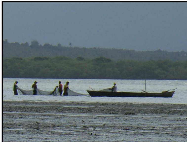
Figura 9. Pesca com baiteira utilizando rede.

As embarcações utilizadas para captura das sardinhas são baiteiras à vela ou remo ou ainda baiteiras motorizadas (Figura 9). O poder de pesca permaneceu constante nos últimos anos, as redes são de nylon transparente, têm em média aproximadamente 300 m. As pescarias duram menos de um dia e não utilizam nenhum tipo de mecanização. De acordo com os pescadores a safra destas espécies ocorre durante o verão. Ao ser desembarcado, o pescado é tratado e salgado. O pescado salgado vai para os atravessadores que comercializam principalmente nos mercados de Goiana, Recife e regiões circunvizinhas.