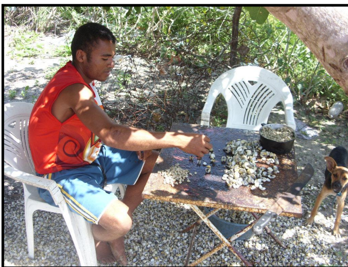
Figura 7. Beneficiamento de Mariscos realizado no quintal da casa de um morador.

Após beneficiados (Figura 7), os mariscos são vendidos aos atravessadores. Durante a alta estação, período em que ocorre maior demanda do pescado, as marisqueiras coletaram em maior quantidade e conseguem vender não só aos atravessadores, mas também aos veranistas. Nesse período, pelo aumento na oferta, o preço cai, porém as vendas aumentam, compensando a queda no valor de comercialização. Na baixa estação, a coleta diária de marisco, tem baixa representatividade, com isso, o valor de comercialização tem um aumento significativo e poucas vendas. Durante esse período a renda mensal das marisqueiras sofre uma redução bastante significativa para a renda familiar.