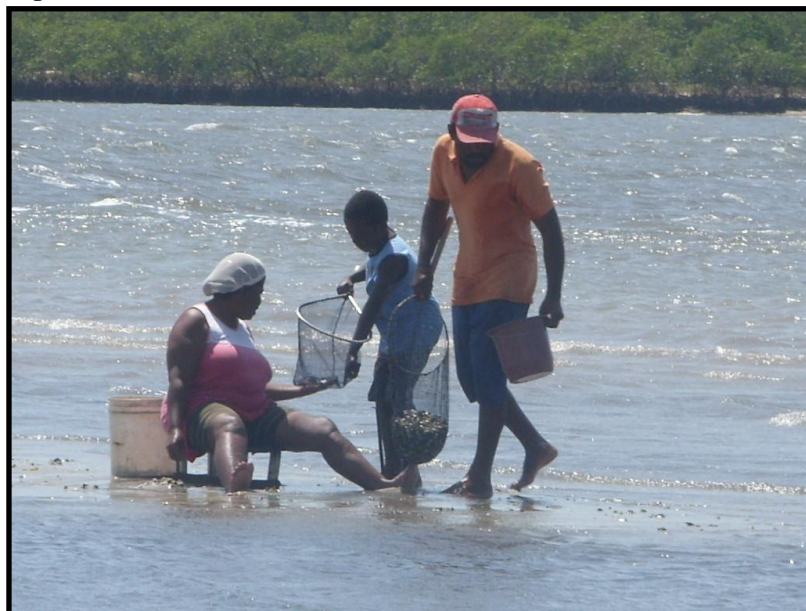
Figura 8. Trabalho realizado em família.

A maioria dos pescadores/catadores e marisqueiras entrevistados eram naturais da região, sendo de Atapuz, Carne de Vaca, Gambá e Itapissuma. A escolaridade dos pescadores do sistema demonstrou um número preocupante de analfabetos, que respondem por mais de 30% dos pescadores entrevistados com idade entre quarenta e cinquenta e cinco anos, entretanto, todas as crianças filhas e filhos das marisqueiras entrevistadas, mesmo descendendo de pais analfabetos, estavam matriculadas no ensino básico ou fundamental.