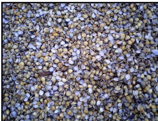
Figura 6. Mariscos

Os mariscos (Figura 6) coletados são: unha de velho , marisco redondo , sururu e marisco pedra , Nas margens do rio e estuário ou no manguezal de todo o litoral norte.