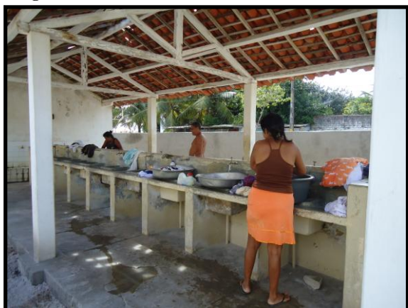
Figura 1. Moradores na lavanderia coletiva.