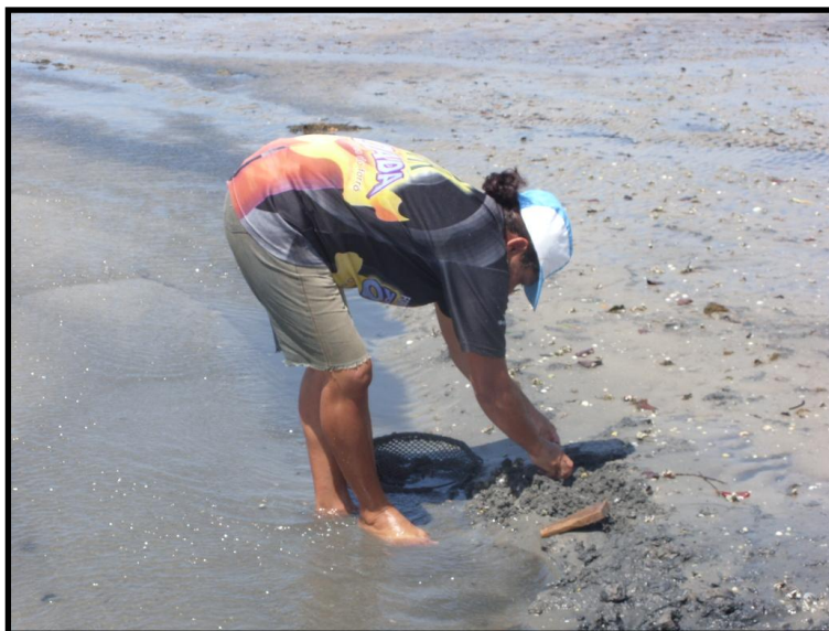
Figura 11. Posição em que as marisqueiras precisam ficar por longos períodos de tempo, durante o trabalho na coleta de mariscos.

Longas jornadas e elevada carga de trabalho, associadas à postura curvada (Figura 11) durante a realização da coleta, quando permanecem agachadas por horas e com parte do corpo mergulhado em lama e água, bem como o peso em excesso transportado ao final do trabalho provocam dores lombares e inchaço nos pés, braços e mãos.