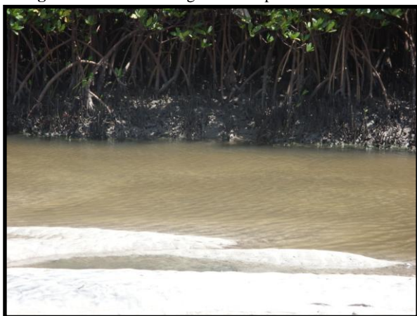
Figura 13. Área de mangue em Atapuz.