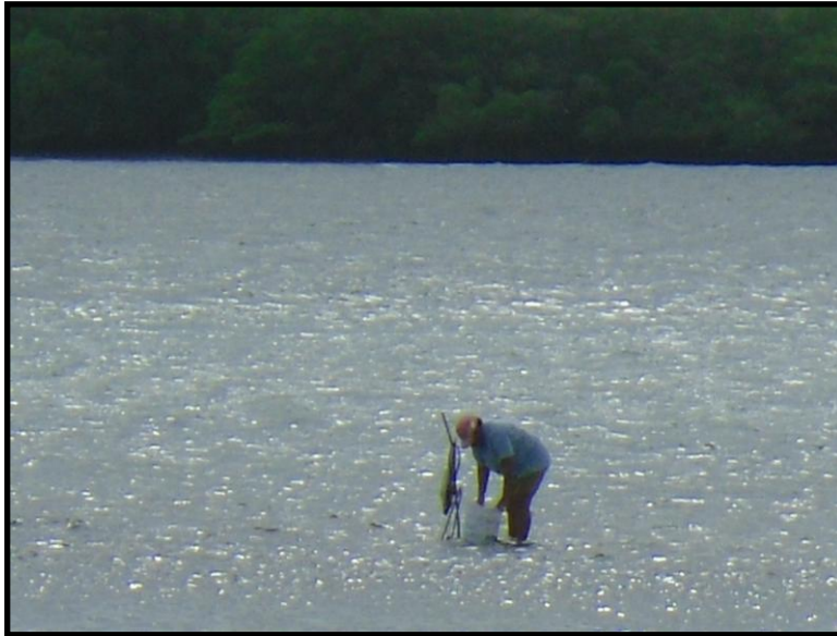
Figura 14. Pesca de siri utilizando jereré, na Prainha em Atapuz.