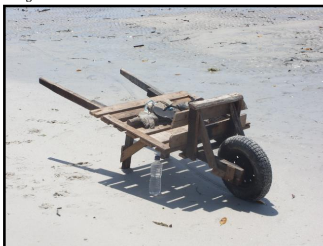
Figura 10. Instrumentos de trabalho.

O trabalho desconsidera as condições climáticas, porque estas mulheres dependem da catação dos mariscos e/ou siris para cumprir compromissos, como pagar luz e água, fazer feira, comprar remédios, dentre outras despesas. É uma jornada diária de mais de dez horas de trabalho debaixo do sol ardente. São longas caminhadas de suas residências até os locais de catação. Na ida são levados os seus instrumentos de trabalho (Figura 10) e no retorno, os baldes são apoiados sobre suas cabeças, causando-lhes desconforto e dor, por causa do peso enorme, já que os animais ainda se encontram dentro de suas conchas.