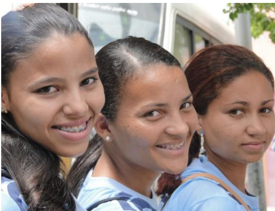
Figura 1: jovens do Giral aguardam o ônibus em Glória do Goitá.

Esses aparatos já são evidências do sentido e usos que eles dão as mensagens