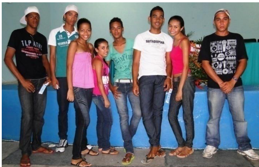
Figura 12: Jovens de Glória do Goitá na abertura do curso de comunicação.

Conservação e Recuperação da Mata Atlântica de Glória do Goitá (2012), a maioria está em idade escolar e “estão buscando inserção no mercado de trabalho, ou já se encontram