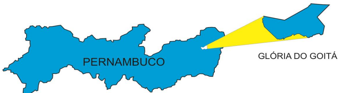
Figura 1: Mapa de PE, com destaque para Glória do Goitá. Arte: J.S.S.Júnior

Glória do Goitá é conhecida como a terra berço do mamulengo 48 . Além de se destacar em Pernambuco como rota da cultura popular, o município tem vocação para a agricultura familiar e realiza festas religiosas e profanas para comemorar os festejos típicos do local. Veja o mapa: