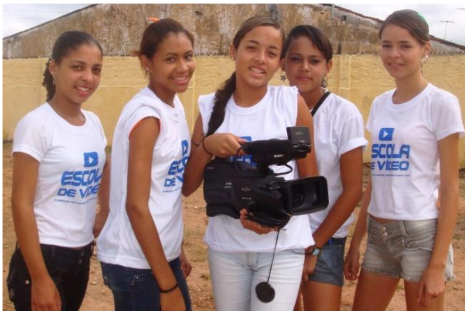
Figura 14: Jovens na aula de cinegrafia durante o curso de audiovisual.