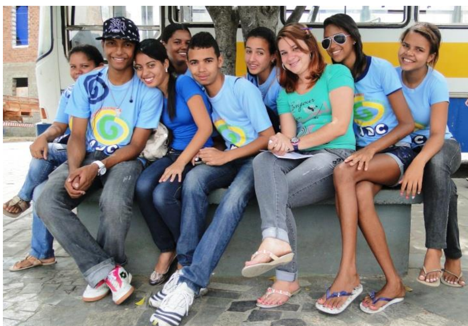
Figura 7: Jovens na Praça em Glória do Goitá depois das atividades de formação no Giral.

Todo o processo se inicia com a mobilização para seleção dos jovens para