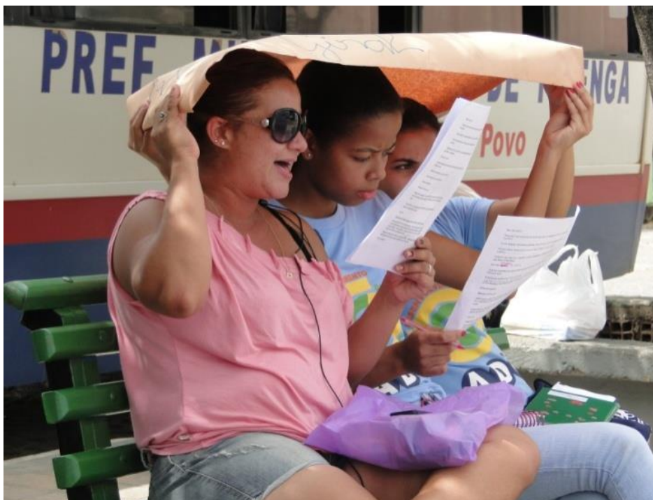
Figura 9: Comunicadoras em ação de mobilização.

Entre os maiores desafios da Instituição, os técnicos e jovens falam da dificuldade na mobilização de recursos, dos conflitos de uma coordenação colegiada, da dificuldade em