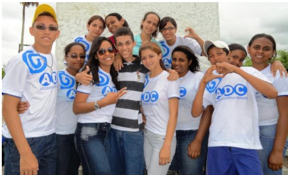
Figura 2: Jovens comunicadores em atividade de pesquisa em Glória do Goitá.

Os jovens egressos do Giral, entrevistados para a pesquisa têm idade entre 19 e 23 anos, sendo seis jovens homens e quatro jovens