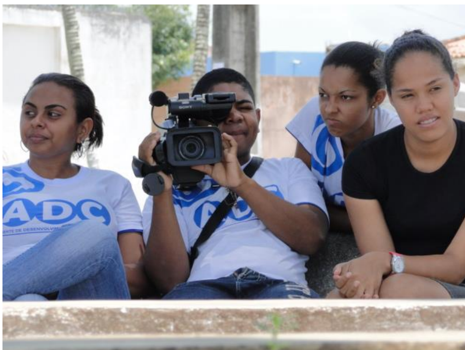
Figura 6: Jovens comunicadores na aula de cinegrafia.

São produções que trazem à tona uma série de acontecimentos e realidades que são pouco discutidas nas sociedades e que merecem melhor atenção por parte dos gestores públicos e da sociedade civil. Pois, como afirma Barbalho (2006), “ao participar de forma ativa do processo comunicativo, os jovens tornam-se consumidores críticos dos sons e imagens ofertados em profusão no mercado informacional ao articularem produção e consumo por meio de seu trabalho” (BARBALHO apud BARBALHO, 2006, p.10). Essa afirmação de Barbalho é percebida nas falas e discursos dos jovens comunicadores do Giral, além da criticidade sobre a programação da televisão televisiva brasileira, eles comentam sobre como são produzidas, com quais objetivos e porque são produzidas. Nesse