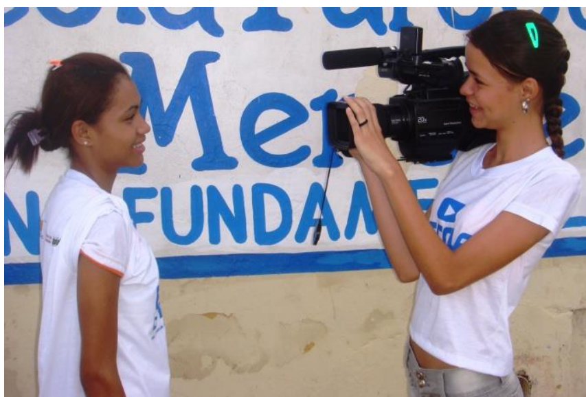
Figura 3: Jovens do Giral na aula prática de cinegrafia.

O objetivo desse capítulo é apresentar as propostas do Giral e o trabalho com as juventudes de contextos populares nos usos das tecnologias da comunicação. Nele, iremos perpassar pelos objetivos da