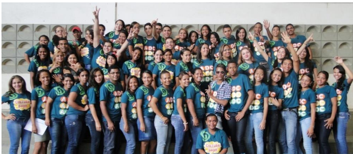
Figura 21: Jovens comunicadores formados pelo Giral no evento de conclusão do curso.

tecnologia que condiciona as aspirações desses jovens e os mobilizam para participar dos cursos do Giral para, a partir deles, buscar novas aspirações de inclusão social, desenvolvimento profissional e geração de renda.