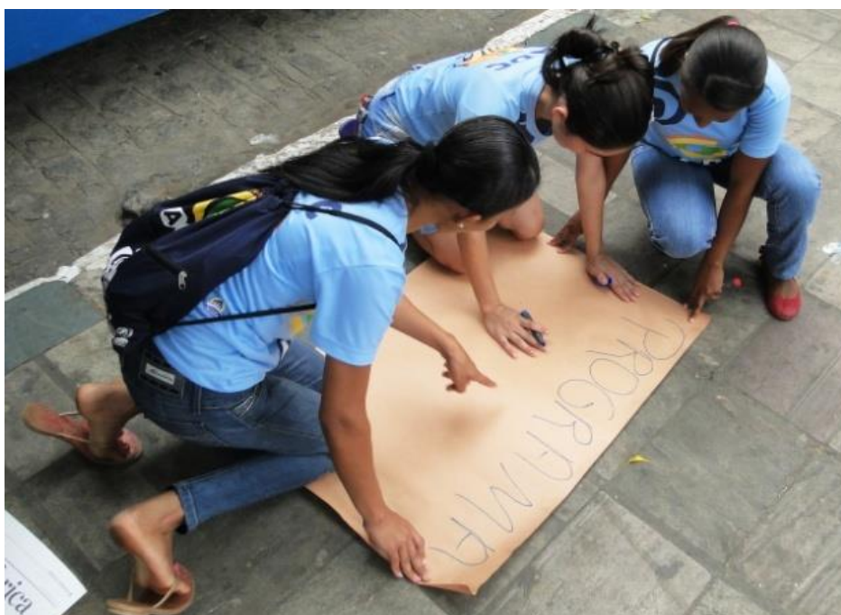
Figura 15: Jovens roteirizando nas ruas de Glória do Goitá.

Com essa compreensão, e com a observação das apropriações das mídias, “os