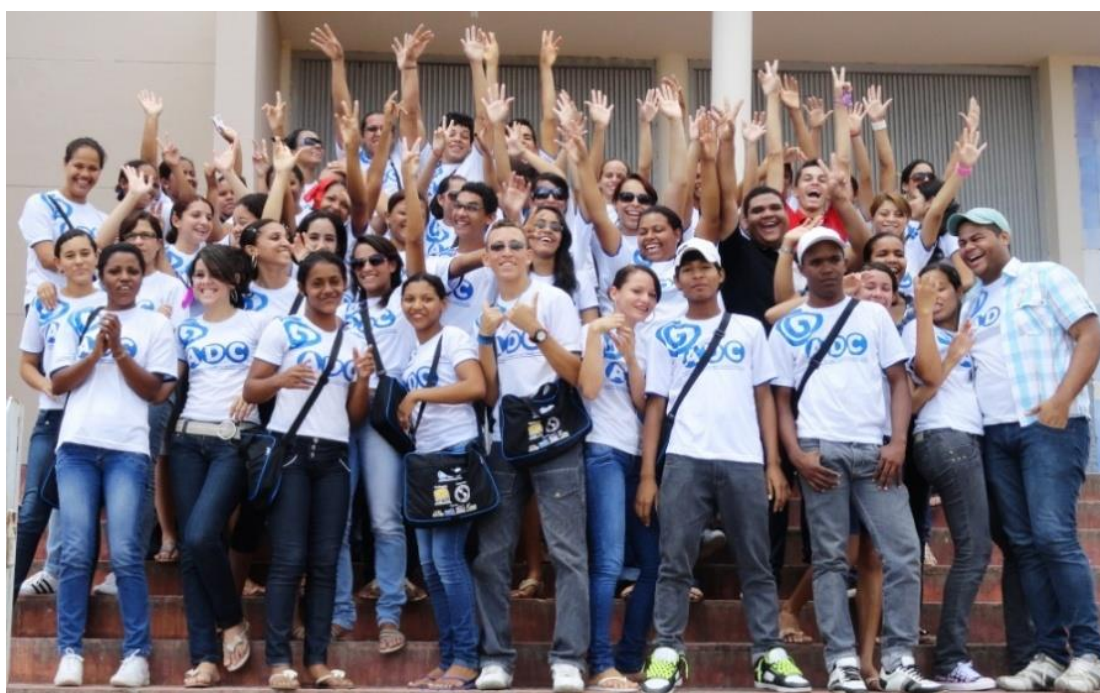
Figura 3: Jovens da III turma do curso de comunicação do Giral.

Na maioria dos casos, o envolvimento com a produção de vídeos reformula a concepção de mundo e a relação social dos jovens com a comunidade. Esse processo