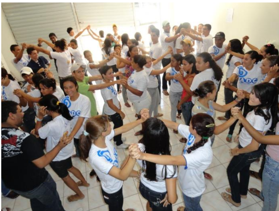
Figura 4: Jovens durante dinâmica de socialização realizada no início do curso no Giral.

O principal curso que o Giral oferece é o de Agente de Desenvolvimento da Comunicação 26 . O projeto oferece mais de 360 horas de formação, divididas por módulos com aulas teóricas e práticas. Nas