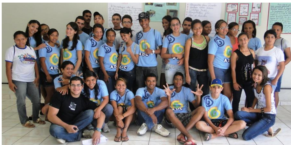
Figura 18: Jovens da IV turma do curso de comunicação do Giral.

restante não geram renda com trabalho em comunic ação.