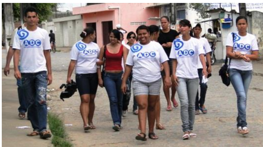
desenvolvimen Figura 2: Jovens nas ruas de Glória do Goitá, indo para as aulas no Giral.

Mais uma iniciativa que reforça a importância de ações comunitárias de comunicação como constituinte capaz de gerar