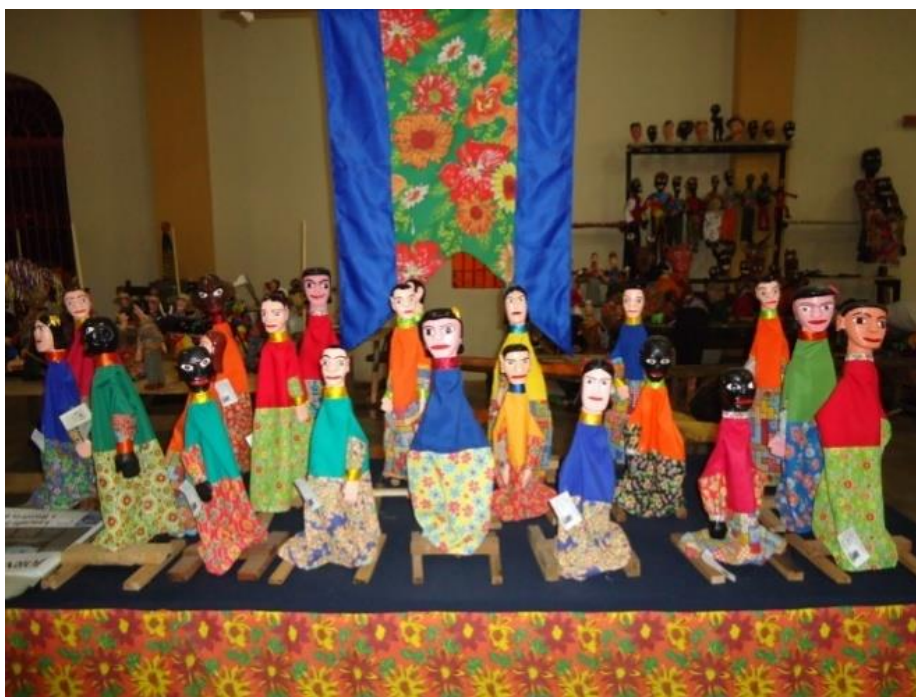
Figura 11: Imagem interna do Centro de Mamulengo de Glória do Goitá.

O município de Glória do Goitá guarda em seu cotidiano, o cenário revelador das